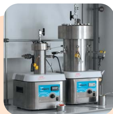
Calorimètres ARSST et VSP 2