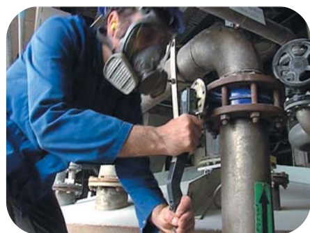
Opérateur chargé d'une action de sécurité