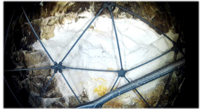
Observation rapide et précise d'une cicatrice d'arrachement en grande hauteur

La partie sommitale d'une cavité en activité est affectée par la chute d'un bloc de faible volume. L'inspection effectuée avec le drone dans un délai court et en toute sécurité met en évidence une fracturation de la craie susceptible de générer un effondrement plus important. Le traitement du secteur, défini et mis en œuvre rapidement, a permis d'éviter un arrêt de l'activité pénalisant économiquement.