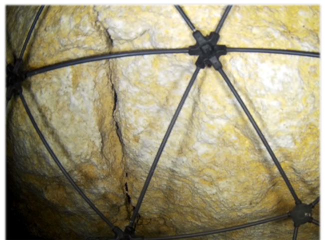
Caractérisation fissurale morphologique, mécanique et hydrologique

Une cavité située à faible profondeur, difficile d'accès et sous des enjeux à protéger, a fait l'objet d'une inspection initiale qui a conclu à la nécessité de suivre périodiquement son état de dégradation. Le drone aérien est utilisé pour renforcer cette surveillance périodique en permettant l'observation et le suivi télédistancé de l'évolution de fissures ouvertes, notamment au regard des infiltrations d'eau potentielles, dans l'attente de travaux de mise en sécurité.